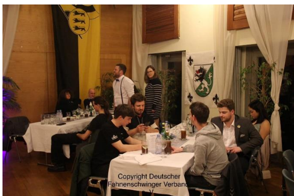
Immer gut drauf.