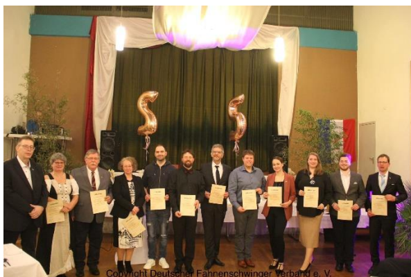
für 20 Jahre Mitgliedschaft.