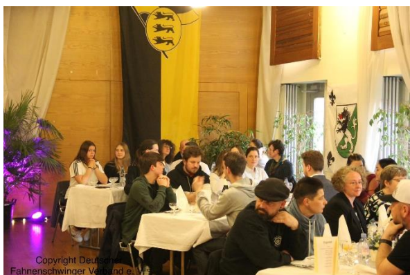
Die Gemütlichkeit kam natürlich auch nicht zu kurz.