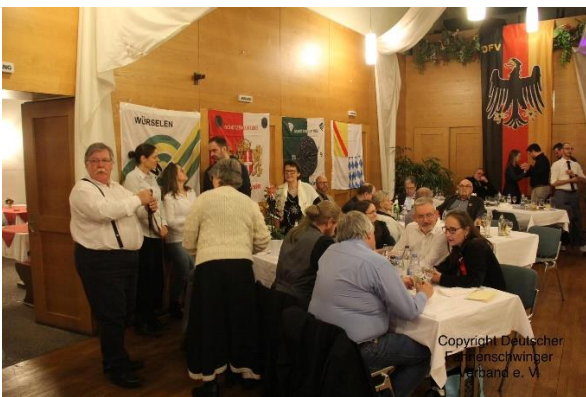
Locker ging es nach dem offiziellen Teil durch den Abend.