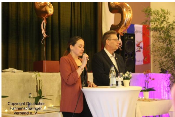
Beginn der Ehrungen.