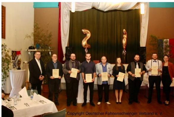
Bundesverbandsabzeichen in Bronze,