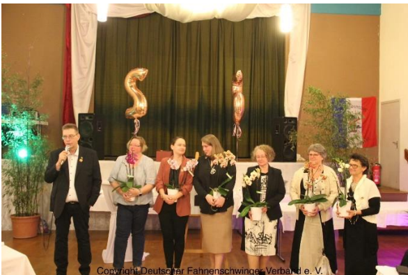
Danke an die Damen für ihre Unterstützung bei der Vorbereitung des Jubiläums.