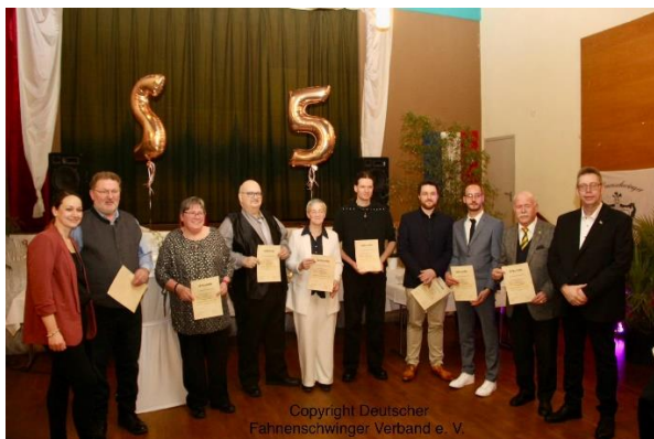
Bundesverbandsabzeichen in Silber,