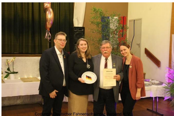
Ehrung für 25 Jahre Mitgliedschaft im DFV.