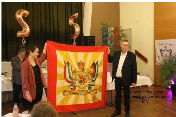
Das Fahmentuch der RFV Bezirk Düsseldorf