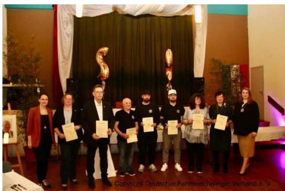
für 10 Jahre Mitgliedschaft.