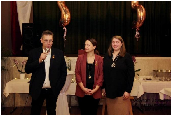
Danke an die Mädels des Arbeitskreises.